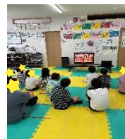
唐津教室と合同体育館遊び