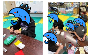
唐津教室と子どもの日合同パーティー