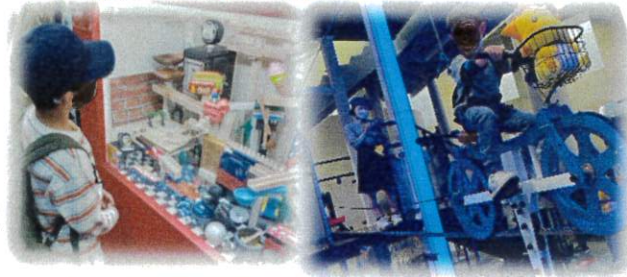
佐賀県立宇宙科学館