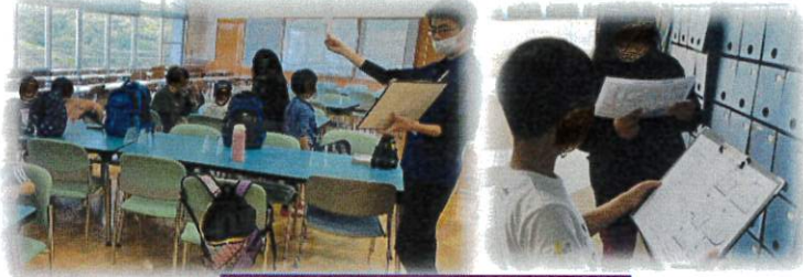
波戸岬少年自然の家