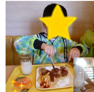
ジョイフルで昼食♪