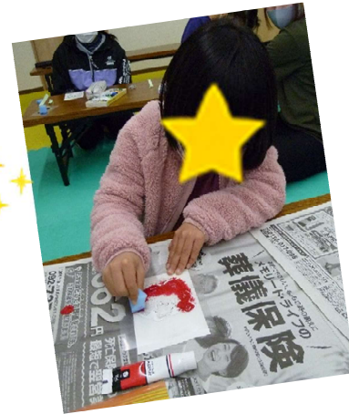
ステンシルで年賀状かいたよ